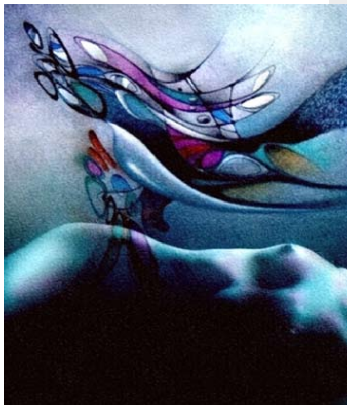
León Alegria/Bluenude 1

Universidad de Guadalajara. CUCS. Departamento de de Clínicas de la reproducción humana, crecimiento y Desarrollo infantil. Hospital no. 320. CP 44280. Teléfono: 11994930